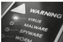
Entfernung von Malware & Viren